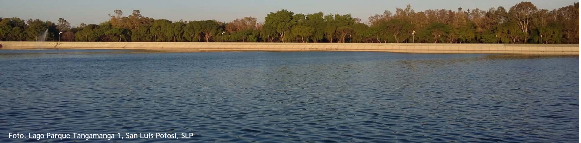
Foto: Lago Parque Tangamanga 1, San Luis Potosí, SLP